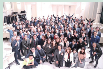
サポーター会の様子