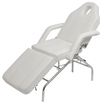
(1) フェイシャルベッド